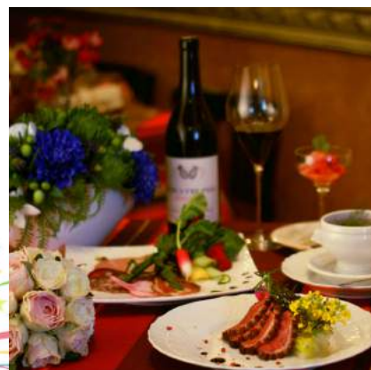
名物フォアグラ鴨と旬の魚料理がWメインになった 横浜創作料理の特別コース

ひとつひとつデザインされた「ラヴァーズブーケ」は、生花では表現できない、最先端の造形技術による創作花で構成された芸術性の高い末永く楽しめる花束です。