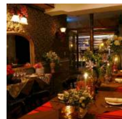
横浜開港時の商館のような とっておきの美食空間