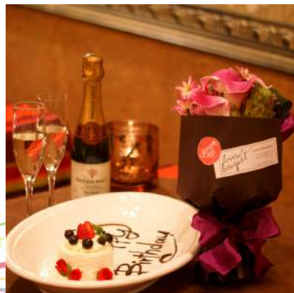
仏スパークリングで乾杯。 セレモニーは豪華なラヴァーズブーケと メッセージが添えられたホールケーキで祝福

①お任せ、②ホワイトグリーン系、③ブルー系、④ピンク系の中からカラーリクエストが可能。ひとつひとつデザインされた「ラヴァーズブーケ」は、生花では表現できない、最先端の造形技術による創作花で構成された芸術性の高い末永く楽しめる花束です。