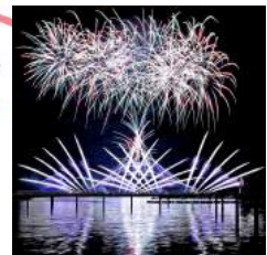
横浜八景島・花火シンフォニア 花火クルーズチケット