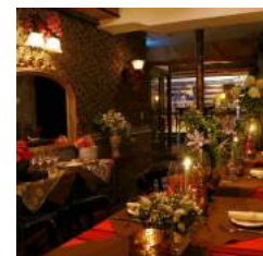
横浜開港時の商館のような とおきの美食空間