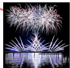
横浜八景島・花火シンフォニア 花火クルーズチケット