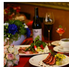
名物フォアグラ鴨と旬の魚の Wメイン特別コース