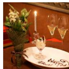
グラスワインで乾杯して ディナーを堪能。